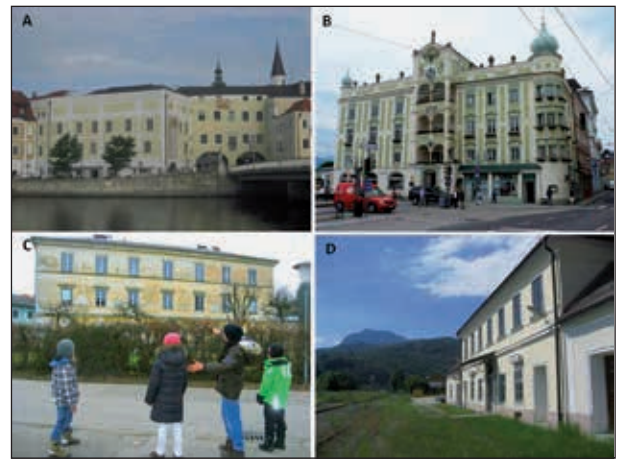
Abb. 14A: Das Kammerhofgebäude an der Gmundner Traunbrücke – Sitz der Kammerhof Museen Gmunden und des Gmundner Stadtarchivs