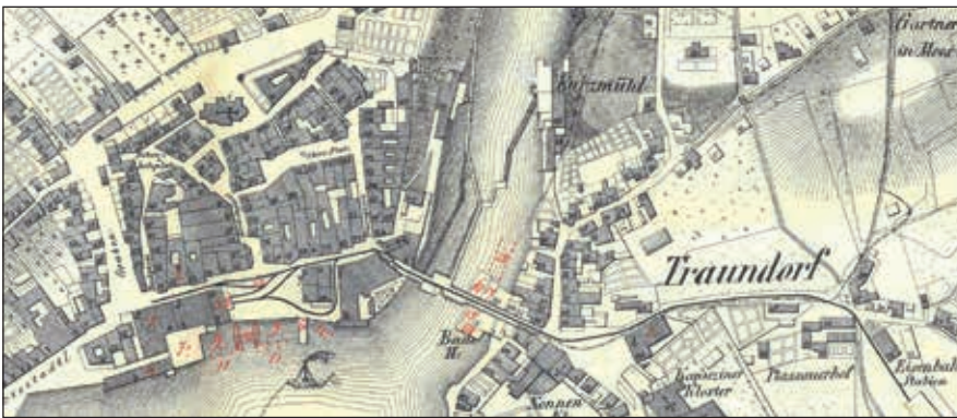
Abb. 5: Ausschnitt aus dem Stadtplan von Gmunden von Carl Ritter (1849) mit der in rot gehaltenen Handnummerierung von Karl Riezinger (1867)

köbel untergebracht werden können. 17. Die Nibushütte wo ebenfalls 2 Salzköbel untergebracht werden können. 18. Die Punkte zeigen ebenfalls Haftsteken, wo zum Beyspiel 12 Salzköbel auf Vorrath sich befinden. 19. Huthmann- oder Lehenplatz, wo die Salzschiffe bey großen Stürmen nur landen können.“