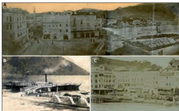
Abb. 8A: Panorama vom Dach des Gmundner Rathauses nach Osten über den Rathausplatz mit den Gleisanlagen der Pferdeisenbahn, den Salzkobeln und dem Dampfer Elisabeth für die Personenschiffahrt

18 Wägen aufgestellt werden. Drei Fotos aus dem Archiv der Kammerhof Museen Gmunden dokumentieren dies eindrucksvoll ( Abb. 8A-C ).