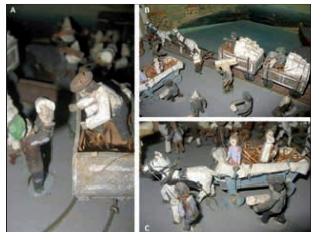
Abb. 7A: Ausschnitte aus dem „Diorama vom Salzumschlag am Stadtplatz von Gmunden“: 3 Wagenlader transportierten die Fuder zu den Wagen und besorgten die Verladung.

Um sich ein Bild von diesen, bei Riezinger und Krackowizer 18 beschriebenen Vorgängen zu machen, ist es hilfreich, das „Diorama vom Salzumschlag am Stadtplatz von Gmunden“ in den Kammerhof Museen Gmunden zu betrachten ( Abb. 7A-C ).