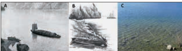
Abb. 4A-C: Salzkobel mit Ra-Segel auf der Fahrt über den Traunsee von Ebensee nach Gmunden (Ausschnitt aus dem Ölbild „Traunkirchen mit dem Traunstein“ von H. Frederik Gude 1871, in Neweklowsky 1952, A); die Ansetz im Jahre 1991 mit Blick nach Süden (Aquarell von und aus Hager 1996, B); noch heute können speziell im Winter bei Niedrigwasser des Traunsees die Holzbohlen des ehemaligen Treppelweges von der Ansetz nach Gmunden besichtigt werden

Bei günstigem Südwind (Oberwind) konnten die von Hallstatt und Ischl kommenden, beladenen Salzschnitte von Ebensee aus mit dem Ra-Segel nach Gmunden gelangen (Abb. 4A). Bei ungünstigen Windverhältnissen oder Flaute konnten die Salzzillen nur bis zur sogenannten Ansetz (Abb. 4B) am hinteren Traunsee-Ostufer fahren, 14 von wo aus sie dann mit Pferden entlang eines mit Holzbohlen befestigten Treppelwegs (Abb. 4C) bis Weyer am Fuße des Grünbergs gezogen wurden. Von Weyer mussten die Schiffleute mit ihren Zillen wieder selbst zum Stadtplatz nach Gmunden fahren.