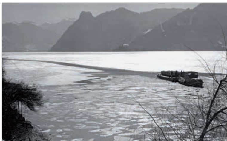
Abb. 9a, b: a. Der zugefrorene Traunsee im Jahre 1929 im Be-reich des Seebahnhofs mit dem eingefrorenen Zugschiff Hubert Salvator und dem dazu gehörigen Ponton für den Kalktransport von den Stainingen Kalkwerken am Fuße des Traunsteins zur Eisenbahnverladung, b. Das Zugschiff samt Ponton für den Kalktransport vom Stein-bruch Eisenau zum Kalkwerk am Traunsee-Ostufer in der Fahrrinne durch den zugefrorenen Traunsee im Jahre 1963