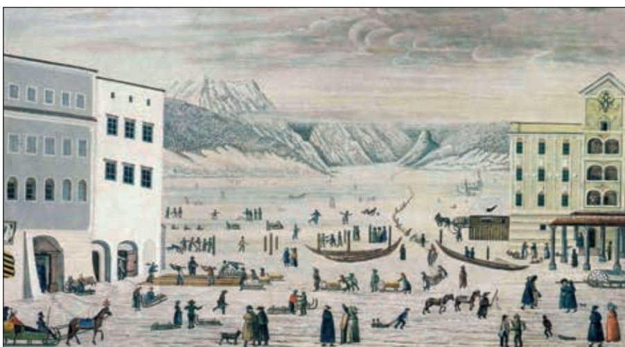
Abb. 2 und 3: Salztransport über den zugefrorenen Traunsee am 7. Februar 1830: 2) Aquarell des Tuchscherers und Malers Johann Eberl, signiert und datiert mit 1830 (Archiv Kammerhofmuseum Gmunden), 3) Aquarell-Gouache von F. Rabl, datiert 1833 (OÖ Landesmuseum, Linz)

Diese oben genannten Bilder, die den Traunsee und am Rande den Salztransport im Jahre 1830 zeigen, scheinen nicht nur romantisch verklärt dargestellt zu sein, sondern man gewinnt auch den Eindruck, dass ein Maler vom anderen das Hauptmotiv übernommen hat und nur kleinere Details geringfügig abgeändert wurden. So zeigen etwa die Bilder von Johann Eberl ( Abb. 2 ) und jenes von F. Rabl ( Abb. 3 ) dieses Phänomen der Wiederholung von Motiven deutlich: