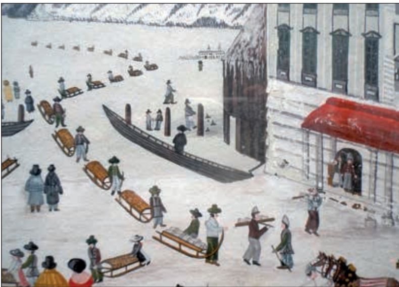
Abb. 4a und 4b: Detailausschnitte aus Abb. 4

tete der Maler; dies schien ihm keine wichtige Information zu sein