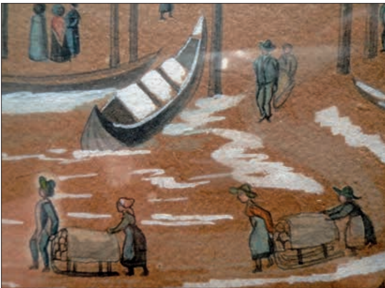
Abb. 2a und 2b: Detailausschnitte aus Abb. 2

Kolonne bishin zu den Salzträgern, die in Richtung Salz Keller gehen, hervorgehoben als bei J. Eberl; auffällig ist auch, dass bei beiden Malern im Gegensatz zu den meisten Beschreibungen dieses Transportes, nicht je ein Mann einen Salzschlitten zieht, sondern meist zwei (oder sogar drei) Personen, wie etwa Mann mit 2 Kindern, Frau mit Kind, 2 Frauen etc. (Abb. 2b)