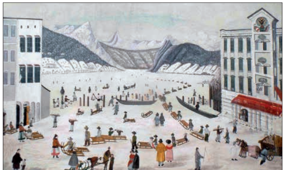
Abb. 4: Salztransport über den zugefrorenen Traunsee im Februar 1830, Aquarell-Gouache eines unbekanntes Malers (Archiv Kammerhofmuseum Gmunden)

Kolonne bishin zu den Salzträgern, die in Richtung Salz Keller gehen, hervorgehoben als bei J. Eberl; auffällig ist auch, dass bei beiden Malern im Gegensatz zu den meisten Beschreibungen dieses Transportes, nicht je ein Mann einen Salzschlitten zieht, sondern meist zwei (oder sogar drei) Personen, wie etwa Mann mit 2 Kindern, Frau mit Kind, 2 Frauen etc. (Abb. 2b)