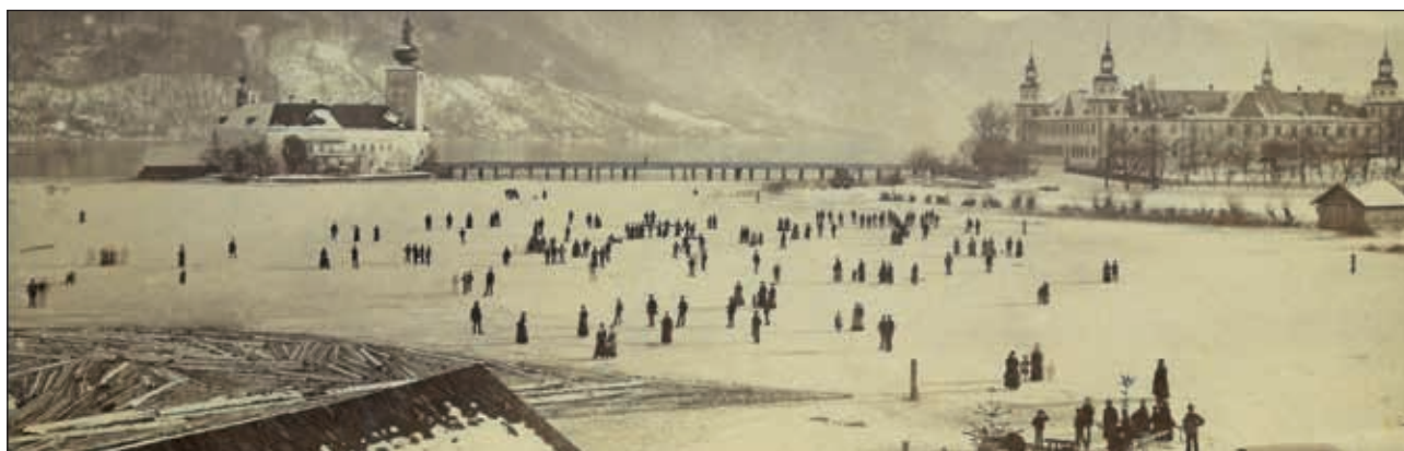
Abb. 8: Bevor der Traunsee im Jahre 1895 gänzlich zufror, gab es bereits in der eisbedeckten Orter Bucht ein reges Freizeittreiben auf dem Eis; Anmerkung: bei den „Schattengestalten“ handelt es sich um jene Personen, die sich während der langen Belichtungszeiten bewegt haben