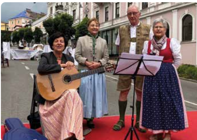
Rock, Pop, Elektro gehören dazu, aber auch Volksmusik ist ein Teil der Fête.

Anmeldung erbeten per Mail an kulturabteilung@gmunden.ooe.gv.at oder telefonisch unter der Nummer 07612 / 794-81.