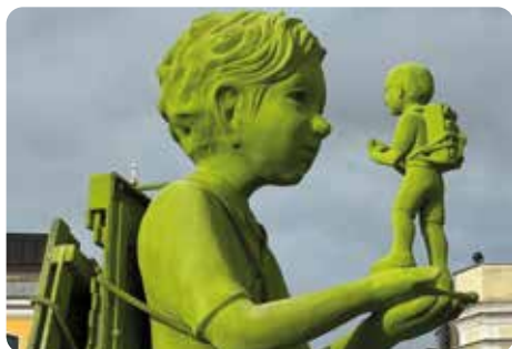
Felix heißt der große, Findus der kleine.

Es hat etwas länger gedauert, bis die Spitznamen der beiden grünen Moosmänner auf dem Rathausplatzbrunnen ausgewählt waren. Kim Simonssons Kreation mit dem offiziellen Namen "La Communication" sollte eine an Gmunden und die Umgebung angelehnte inoffizielle Bezeichnung erhalten. Die Jury hat es sich nicht leichtgemacht und nach vielen Diskussionen Felix für den großen und Findus für den kleinen Grünling gewählt.