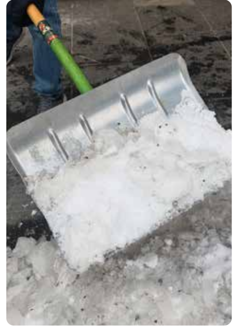
Verpflichtung zum Schneeräumen

Werden Schneestangen durch Fahrzeuge angefahren und beschädigt, ist unverzüg-