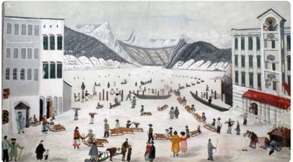
Ein Bild dessen, wie es vor fast 200 Jahren war, zeigt den Salztransport über den zugefrorenen Traunsee von Ebensee nach Gmunden mit einfachen Holzschlitten. Abgebildet ist eine Szene aus dem Februar 1830.

Zu sehen sind unter anderem Objekte aus dem Salztransport zu Wasser und zu Land,