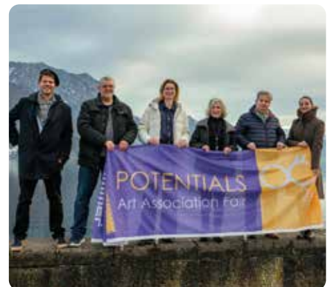
Messeleitung und Jury der POTENTIALS OÖ 2026

Im Zentrum der Messe steht das Bewusstsein für die regionale Schaffenskraft. Die POTENTIALS OÖ bietet der Kunst, den Künstlerinnen und Künstlern dahinter und auch der hohen Qualität der Werke eine große Bühne. Gezeigt werden künstlerische Arbeiten, die in den Ateliers und Kunstvereinen des Landes entstanden sind – ein authentischer Querschnitt durch eine lebendige Szene, die sich durch Beständig-