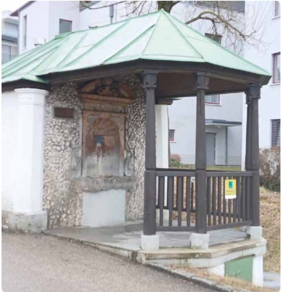
Gmunden gilt als die Stadt der 13 Brunnen – im Bild das Heilige Bründl im Brunnenweg.

Die ersten Ursachen lassen sich durch vorbeugende Maßnahmen minimieren. Unzulässige Anschlüsse von Eigenwasseran-