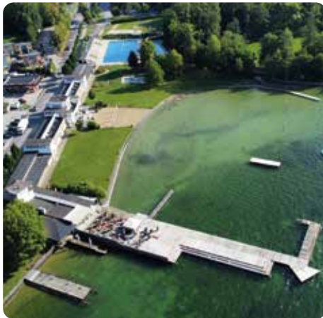
Das Gmundner Strandbad aus der Vogelperspektive

Um in unserem Strandbad in der Übergangszeit eine Beckentemperatur von 21° zur Verfügung zu stellen und warmes Duschwasser zu haben, wurden dort vor vielen Jahren ein Gaskessel und eine thermische Solaranlage installiert. Nun ist der Gaskessel an seinem Lebensende angekommen und es wurden Angebote für einen Ersatz eingeholt. Noch bevor das Thema in einen Ausschuss kam, war es auf der Agenda des Stadtrates und sollte im Jänner 2026 beschlossen werden. In kürzester Zeit zeigten wir Grüne die Machbarkeit und Wirtschaftlichkeit einer Wärmepumpe statt eines Gaskessels. Denn die Stadtgemeinde hat im Frühjahr und Sommer einen Stromüberschuss aus den eigenen PV-Anlagen und kann diesen im Strandbad über die Energiegemeinschaft verwenden. Eine Wärmepumpe hat von Mai bis September auch einen wunderbaren Wirkungsgrad. Nun ist die Stadtgemeinde dabei, Angebote für Wärmepumpen einzuholen. Allein dieses Beispiel zeigt, dass eine starke GRÜNE STIMME in der Stadtpolitik wichtig ist.