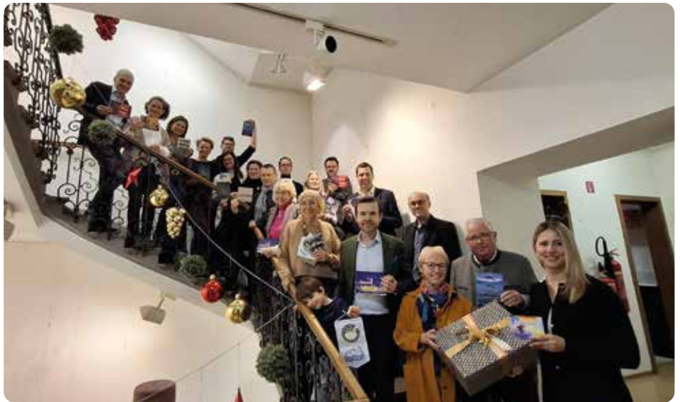
Die Mitglieder des Gmundner Kunstvereins bei der Spendenübergabe im Rathaus mit Bürgermeister Krapf

Das vom Gmundner Kunstverein initiierte neue gemeinsame Sozialprojekt "Gmundner Kunstpostkarten" konnte knapp 6500 Euro erwirtschaften. Das Geld wird für einen guten Zweck gespendet.