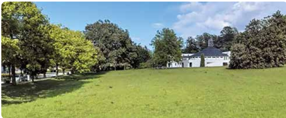
Blick auf die Wiese in Richtung Pfarrkirche Gmunden-Ort

Exemplarisch kann hier die Entscheidung erwähnt werden, die Kindergartenmöglichkeiten im Pensionat umzubauen und zu adaptieren, ohne dass diese Räumlichkeiten in der Folge im Besitz der Gemeinde stehen werden. Alternativ zur getroffenen Entscheidung, diesen Kindergarten