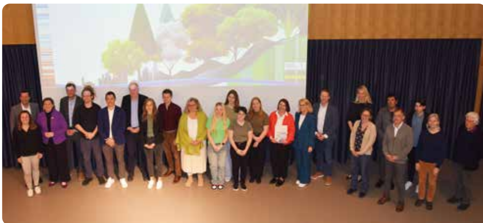
So war es im Vorjahr: die Nominierten zum Klimaschutzpreis 2025 auf der Bühne der Landesmusikschule

Im Anschluss erfolgt die Verleihung des Kli-